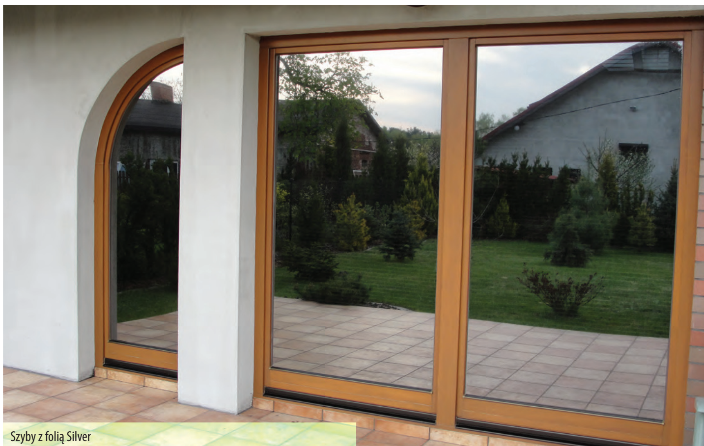
Szyby z folią Silver

usuwany jest tuż przed montażem folii na szybie. Folia okienną zazwyczaj instaluje się techniką „na mokro” przy użyciu wody z dodatkiem środka powierzchniowo-czynnego (szampon, płyn do mycia naczyń itp.) lub specjalnych płynów do montażu folii. Na umytą i mokrą powierzchnię szyby przykładana jest folia docięta pod wymiar i pozbawiona warstwy zabezpieczającej klej. Następnie przy użyciu specjalnego rakla wyciska się pozostałą wodę lub płyn do montażu folii z przestrzeni między folią a szybą, zaczynając od środka i kierując się do brzegów folii. ■