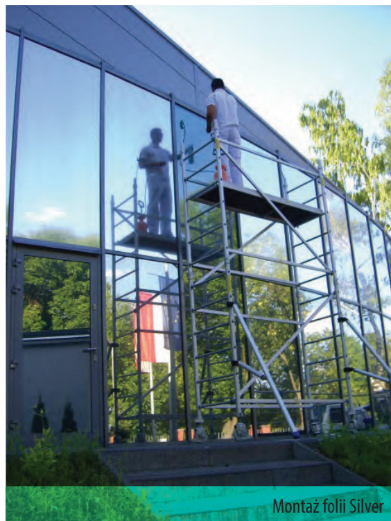
Montaż folii Silver

działają jak membrana odbijająca falę wybuchową, a folie termoizolacyjne (Ecotermic) zapobiegają stratom ciepła zimą, poprawiające współczynnik przenikalności cieplnej szyby. ▶